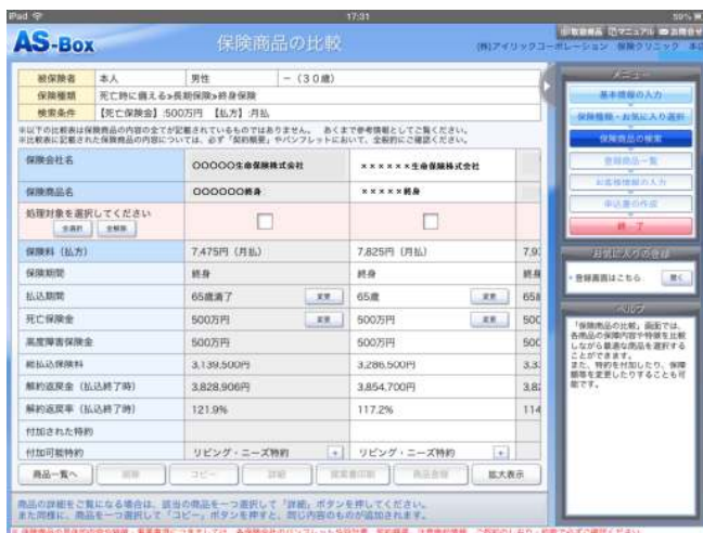
保険商品 比較画面

『AS-BOX』は、乗合保険代理店や保険販売会社向けに、お客様への保険商品の提案ができる業界唯一のツールとして、当社が独自開発し提供しているシステムです。お客さまや販売担当者は、パソコン上で簡単に保険商品の比較等を行うことができる機能や、印刷可能な「共通提案書」は保険会社・商品に関わらず共通のフォーマットで出力されます。