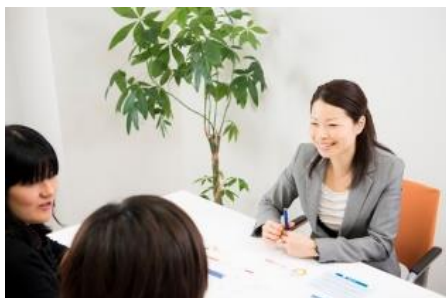
保険だけでなく、家計や資産形成などお金まわりの様々なご相談にお応えしております。

(全国 182 店舗、甲信越地区で 10 店舗、新潟県で 4 店舗 2018 年 9 月 19 日時点)