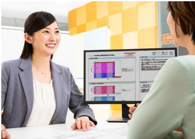
お客様それぞれにぴったりの保険選びを、 スタッフ一同サポートいたします。

1999年の第1号店オープンから今年で20周年を迎える『保険クリニック』は、おかげさまで全国200店舗となりました。これからも“わかりやすい”、“納得できた”を一番に考えた保険選びをお手伝いしていきます。