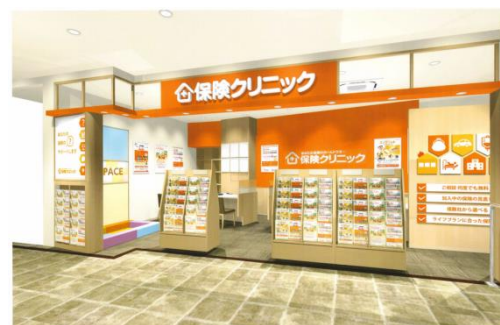
店舗外観イメージ