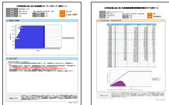
法人の既契約保険の保険証券から保障内容の分析ができます。

法人保険を取り扱う保険代理店や銀行・保険会社において、これまでは法人保険を分析するために、保障内容を調べて Excel 等でグラフを作る必要がありましたが、本機能を活用することにより短時間(「かんたん入力」※であれば最短3分)で、「証券分析シート」を作成することができます。(リリースの際、帳票内容が変更となる可能性がございます。)