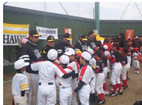
募金をする参加者と、募金の呼びかけをする講師

当日は、参加者・来場者の方々を対象に、「平成 28 年熊本地震」の被災者の方々への募金活動を行いました。当日集まった寄付金に、『保険クリニック』運営本部である株式会社アイリックコーポレーション本社社員による寄付金を加え、総額 29,340 円を、熊本県へ寄付させていただきました。