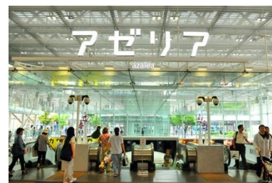
川崎駅直結のアゼリアに 2 店舗目！