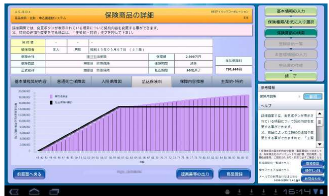
保険商品 詳細画面