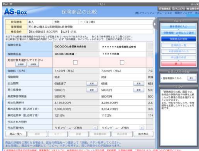
保険商品 比較画面

価格：AS-BOX 基本機能…初期登録料 31,500 円、月額利用料 15,750 円(税込み)