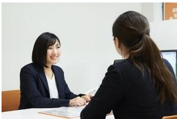
保険だけでなく、家計や資産形成など お金まわりの様々なご相談にお応えしております。

「人と保険の未来をつなぐ ～Fintech Innovation～」をきっかけ、保険販売事業、ソリューション事業、システム事業を手掛ける株式会社アイリックコーポレーション(本社:東京都文京区 代表取締役:勝本竜二、証券コード:7325、以下「当社」)は、広島県広島市にて『保険クリニック』ゆめタウン安古市店をオープン、長崎県諫早市にて『保険クリニック』諫早店を移転オープンいたします。これにより、全国 185 店舗、中国地区で 13 店舗(広島県で 10 店舗)、九州・沖縄地区で 23 店舗(長崎県で 2 店舗)となります。(2018 年 11 月 1 日時点)各店舗の運営代理店や詳細情報については、以下の通りです。