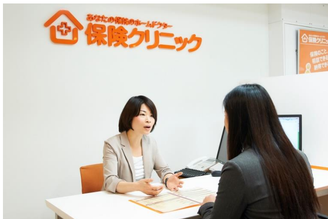
知識・経験の豊かなコンサルタントが親身になってお話を伺います。

(全国189店舗、関東地区で75店舗、神奈川県で12店舗 2019年3月22日時点)