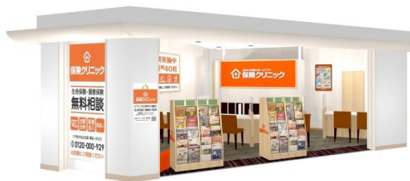
店舗外観イメージ