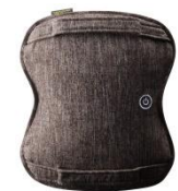
ATEX ルルドプレミアムマッサージクッションダブルもみ AX-HCL258