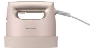
Panasonic 衣類スチーマー NI-FS750