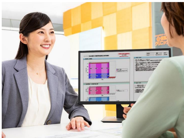
新規加入も、見直しも。保険のことならなんでもご相談ください。

(全国 218 店舗、東海地区で 31 店舗、愛知県で 12 店舗 2020年1月24日時点)