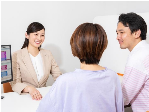
お客様それぞれにぴったりの保険選びを、スタッフ一同サポートいたします。

(全国 219 店舗、甲信越地区で 10 店舗、山梨県で 2 店舗 2020年2月26日時点)