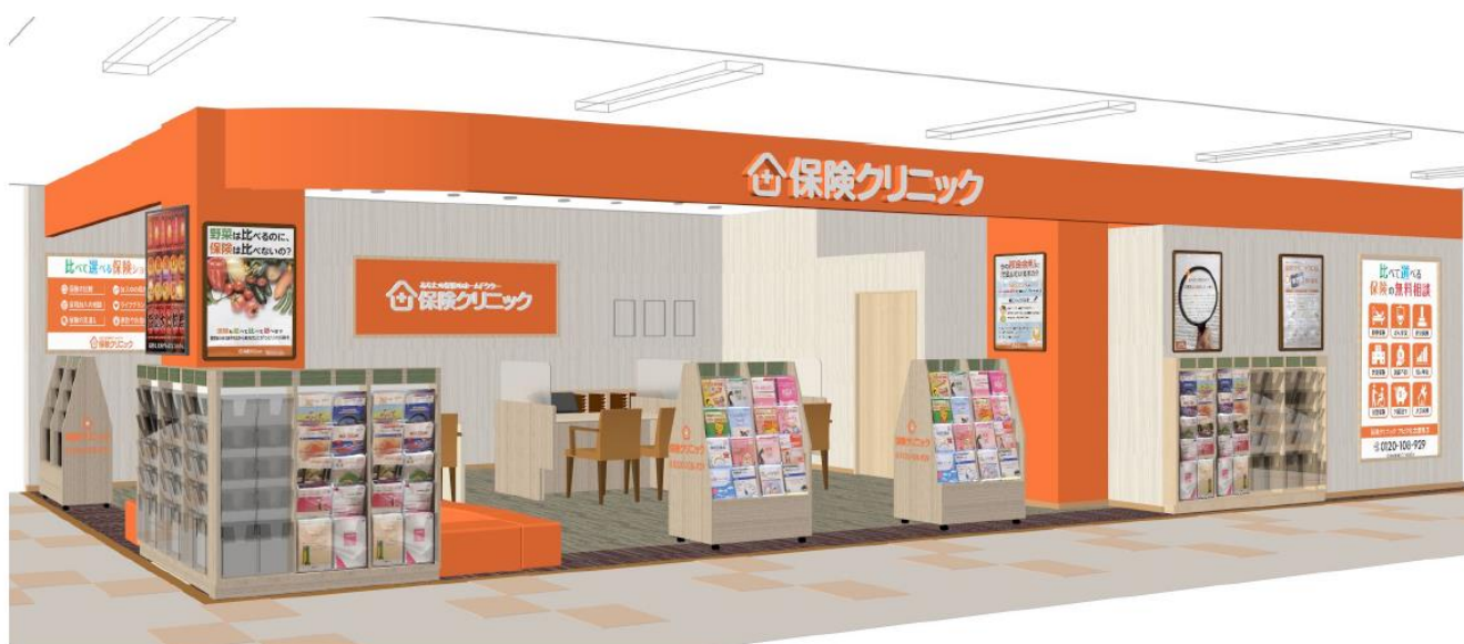
店舗外観イメージ