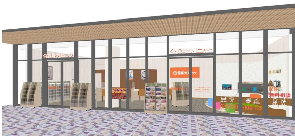
店舗外観イメージ