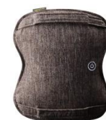
ATEX ルルドプレミアムマッサージクッションダブルもみ AX-HCL258