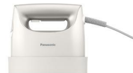
Panasonic 衣類スチーマー NI-FS760