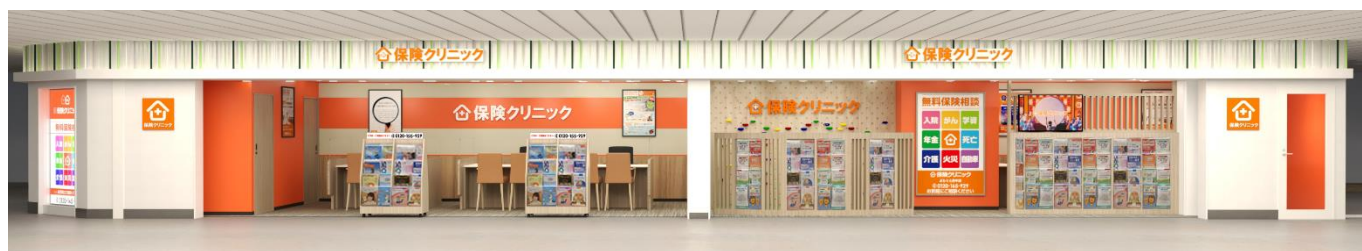
店舗外観イメージ