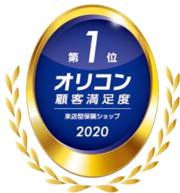
2020年 オリコン顧客満足度®調査 来店型保険ショップ 総合1位