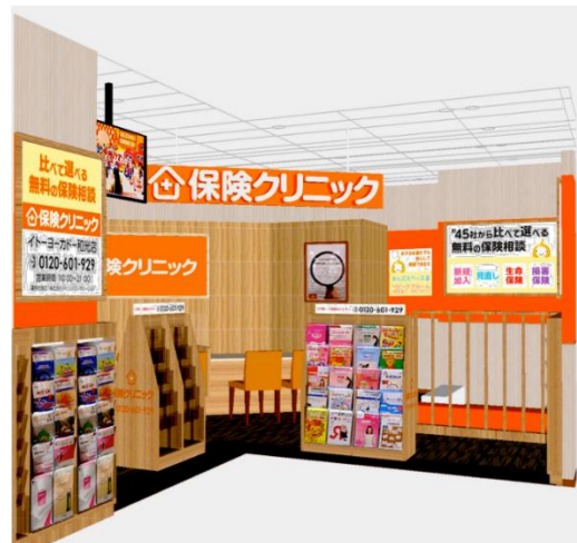
店舗外観イメージ