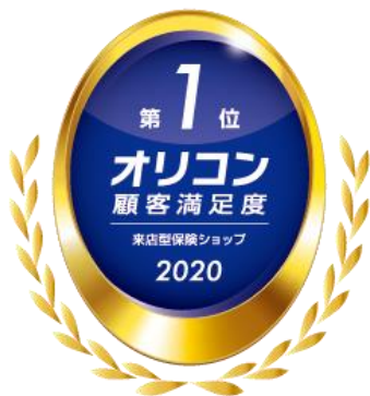
2020年 オリコン顧客満足度®調査 来店型保険ショップ 総合1位