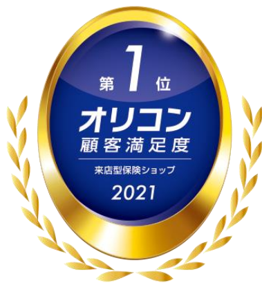
2020年・2021年 オリコン顧客満足度®調査 来店型保険ショップ 総合1位