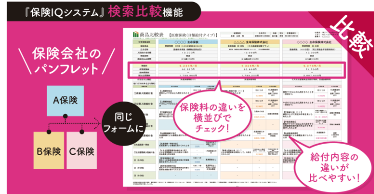
『保険IQシステム』の「商品比較表シート」