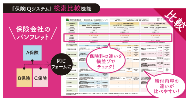
複数の保険商品を横並びで比較。お客様のご要望に沿った保険を見つけられます。

新しく保険の加入や見直しを考えている方向けの機能です。 お客様のご希望をもとに保険商品を検索し、その中からさらにお客様のご希望に沿った複数の保険商品を同じフォーマットで並べた比較表をお出しします。別々の保険会社・保険商品で並べたり、同じ保険商品の中でも保障額や特約を変更して並べることもできます。ご希望に沿わない場合は条件を変更して何度でもお出し致しますので、ご納得できるまで比較頂けます。