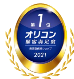
2020年・2021年 オリコン顧客満足度®調査 来店型保険ショップ 総合1位

1999年に日本で初めて*オープンした保険ショップです。 「あなたの保険のホームドクター」をモットーに、コンサルタントの主観に偏らず、 わかりやすく納得できる保険選びをお手伝い致します。 また、保険が必要になった時のフォローや、ライフイベントに応じた保障内容の 見直しなど、長く安心して人生を歩んで頂くためのアフターサービスにも力をいれて おります。しつこい勧誘は一切ありません。 (2020年・2021年 オリコン顧客満足度®調査 来店型保険ショップ 2年連続総合1位)