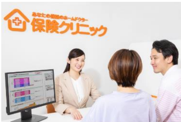
<『保険クリニック®』の証券分析の様子>

加入中の保険の保障内容をビジュアル化したもので、「いつまで」「いくら」保障されているのかがグラフになります。また、複数の保険にご加入されている場合はそれらを合算して表示することができるので、保障内容が一目でわかるようになります。出来上がった証券分析シートはコンサルタントがていねいに説明いたしますので、加入されている保険がご自身に合っているかを確認いただけます。