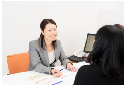
ご相談 1 位は、「加入保険の内容を知りたい」保険会社を問わず、わかりやすくご説明。