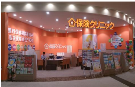
5 店舗とも、地元のお客様が来店しやすいショッピングモール内にオープン。 ※写真はイオンタウンユーカリが丘店