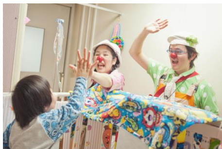
小児病棟でのクリニックラウンの活動を支援

「こどもたちの明るい未来」をグランドテーマとして、保険の原点である「家族」「健康」「命」などというさまざまな観点から、今後、日本全国や地域社会へ貢献できる活動を行ってまいります。