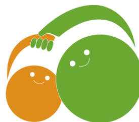
子供の未来は日本の未来